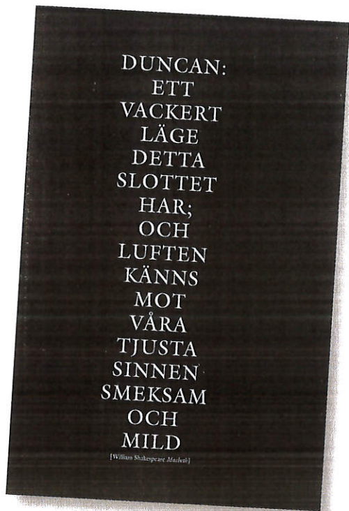
Boken "Luft" presenteras på Nordbygg.

"Luft" är skriven av 23 författare och kommer att säljas via nätbokhandeln Adlibris. *